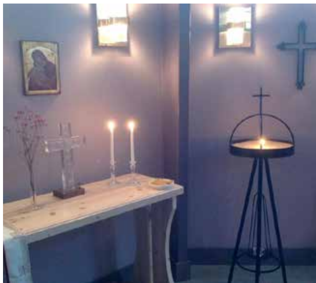
Norrtäljeanstaltens eget kapell där interner läser tideböner, tänder ljus och firar mässa.

är kriminalvården med och bekostar och säkerställer att interner från olika trosinriktningar har möjlighet att träffa en representant från just sitt trossamfund. Svenska kyrkan står dock ekonomiskt på egna ben och finns representerad på de olika fängelserna och häktena i Sverige, men det är Sveriges Kristna Råd (SKR) som har uppdraget att utveckla och samordna själva verksamheten.