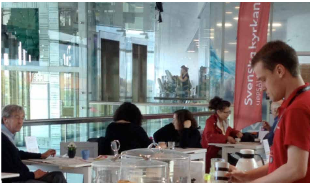
Svenska kyrkans smälter in på ett naturligt sätt i köpcentret.