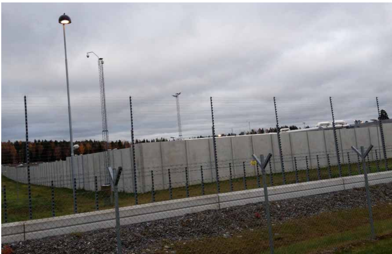
”Jag satt i fängelse och ni besökte mig”.