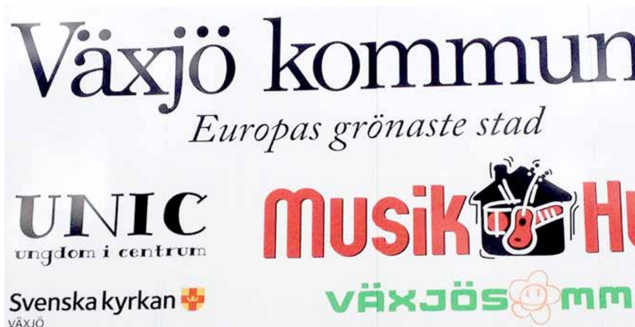
Svenska Kyrkan och Växjö kommun har samverkat i verksamheten UNIC (Unik i Centrum) sedan 1998.