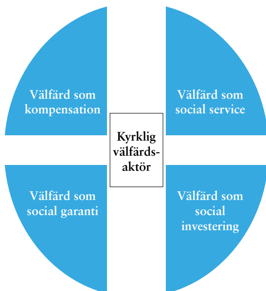
Figur: Utomorganisatoriska faktorer för en kyrklig välfärdsaktör att relatera till.

Med utomorganisatoriska faktorer kan de fyra ovan nämnda välfärdprinciperna få bilda den kyrkliga välfärdsaktörens omgivning(ar). Vilken eller vilka av dessa anknyter man till? Här ska hållas öppet för att det även kan finnas andra principer som kan vara relevanta.